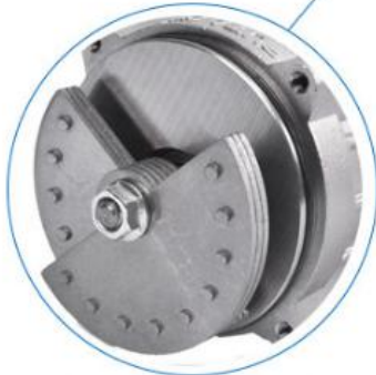
Power Wire Sheath